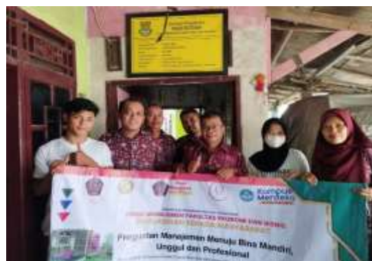
Gambar 2. Dokumentasi UKM Sinar Mutiara