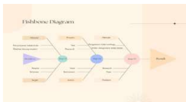
Gambar 1. FishBone Diagram Penelitian

Semua indikator keberhasilan ini harus diukur dan dievaluasi secara objektif dalam rangka mencapai tujuan utama dari penelitian “ Implementasi Six Sigma Untuk Pengendalian Kualitas Produk Krupuk Ikan (Studi Kasus: UMKM Sinar Mutiara Di Desa Karang Serang Kabupaten Tangerang) ’ dengan mengidentifikasi dan mengukur indikator keberhasilan ini, hasil penelitian dapat memberikan wawasan yang berharga dan kontribusi bagi pengembangan UMKM Sinar Mutiara dan usaha mikro, kecil, dan menengah lainnya dalam mencapai kualitas dan efisiensi operasional yang lebih baik.