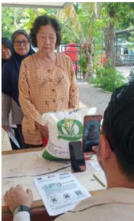
Gambar 6. Bukti penerima bantuan

Tahap berikutnya adalah dokumentasi digital menggunakan teknologi Postal General Cargo (PGC). Petugas memindai barcode pada undangan, mengambil foto penerima bersama dokumen yang diserahkan, dan menyimpan bukti tersebut secara digital untuk keperluan administrasi. Setelah itu, penerima diarahkan ke bagian koordinasi untuk mengambil beras yang telah disiapkan sesuai kuota. Mereka juga diminta memastikan jumlah dan kualitas beras sebelum meninggalkan lokasi.