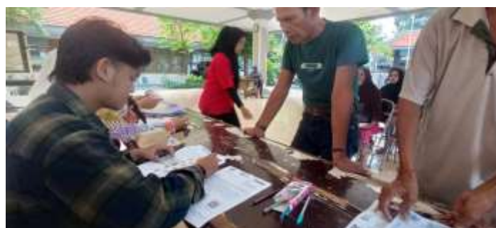
Gambar 5. Verifikasi data penerima

Pada hari penyaluran, penerima datang sesuai jadwal dan mengikuti proses antrian yang telah diatur. Ketika tiba gilirannya, penerima menyerahkan dokumen kepada petugas verifikasi untuk memastikan data sesuai dengan daftar dalam Berita Acara Serah Terima (BAST). Jika data cocok, penerima menandatangani BAST sebagai bukti penerimaan bantuan, dan undangannya diberi paraf serta tanggal oleh petugas.