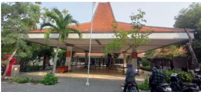
Gambar 1. Lokasi penyaluran bantuan pangan beras

menentukan jumlah bantuan yang disalurkan di setiap lokasi, jadwal penyaluran, serta kebutuhan tambahan seperti alat angkut dan tenaga pendukung. Dengan survei ini, tim memastikan bantuan dapat disalurkan dengan lancar dan sampai ke orang yang benar-benar membutuhkan.