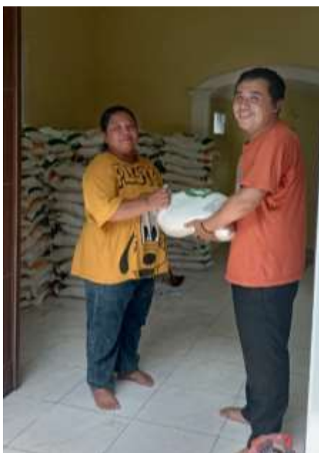
Gambar 8. Penerimaan beras