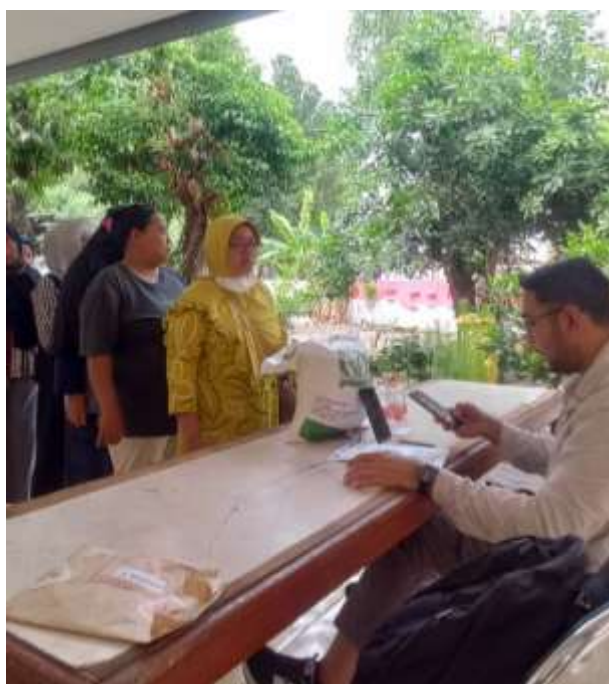
Gambar 7. Bukti penerima bantuan

Setelah semua bantuan disalurkan, penyelenggara mencatat data penerima secara manual dan digital untuk menjamin transparansi dan akurasi. Laporan yang mencakup jumlah penerima, rincian bantuan, dan dokumentasi disusun sebagai bukti administrasi. Tahap akhir berupa evaluasi pelaksanaan dilakukan untuk menilai efektivitas proses, termasuk pengelolaan antrian dan kesesuaian data, guna perbaikan penyaluran di masa mendatang. Dengan mekanisme ini, proses distribusi bantuan beras diupayakan berlangsung tertib, transparan, dan terdokumentasi dengan baik.