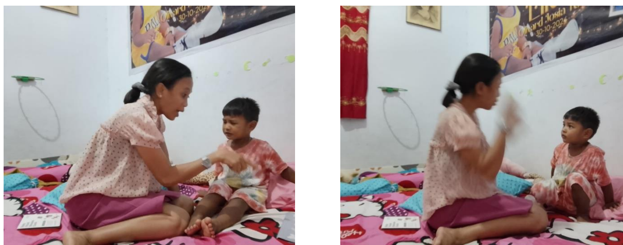
Gambar 3. Orang tua memberikan batas waktu penggunaan gadget pada anak usia dini.

Gambar 3 menunjukkan bahwa orang tua memberikan aturan mengenai batas waktu penggunaan gadget pada anak. Berdasarkan hasil wawancara, anak hanya diperbolehkan menggunakan gadget dalam waktu yang singkat, yaitu sekitar lima menit. Pembatasan waktu dilakukan untuk mengurangi ketergantungan anak terhadap gadget dan membantu anak tetap aktif melakukan aktivitas bermain maupun berinteraksi dengan lingkungan sekitar. Aturan penggunaan gadget menjadi salah satu bentuk pengendalian yang dilakukan orang tua dalam penerapan digital parenting.