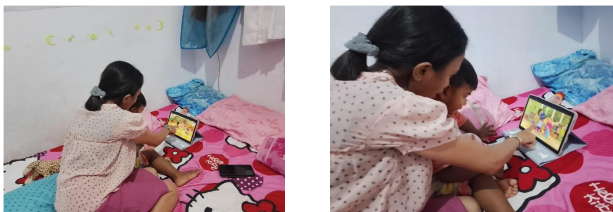
Gambar 4. Anak menggunakan gadget dengan pendampingan langsung dari orang tua.

Gambar 4 memperlihatkan bahwa anak menggunakan gadget di bawah pengawasan langsung orang tua. Pendampingan tersebut bertujuan untuk membantu anak menggunakan media digital secara lebih aman dan terkendali. Kehadiran orang tua saat anak menggunakan gadget juga membantu mengurangi risiko anak mengakses konten yang tidak sesuai dengan usia mereka. Selain itu, pengawasan secara langsung membantu orang tua memahami kebiasaan penggunaan media sosial pada anak sehingga pengendalian penggunaan gadget dapat dilakukan dengan lebih baik