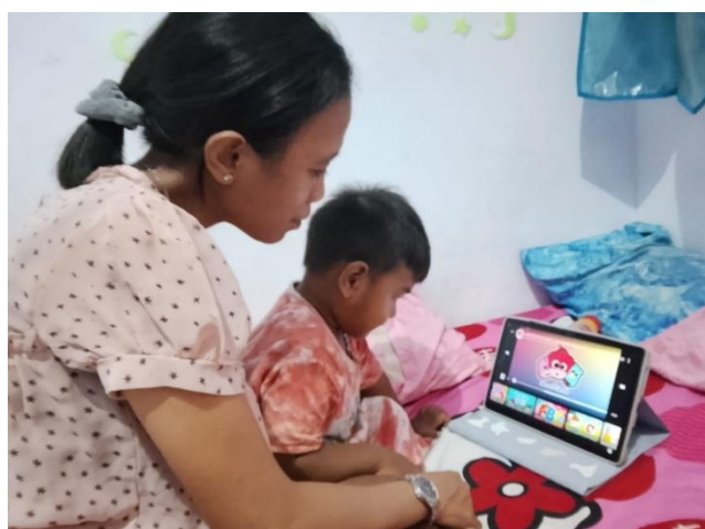
Gambar 1. Orang tua mendampingi anak saat menggunakan youtube kids melalui tablet.

Selain itu, Ibu OT juga mengatakan bahwa apabila anaknya mulai menggunakan gadget melebihi waktu yang ditentukan, maka sementara akan dihentikan untuk mengurangi penggunaan media digital pada anak. Bentuk pengawasan tersebut dilakukan agar anak tidak terlalu lama menggunakan gadget dan terhindar dari konten yang tidak sesuai dengan usianya. Menurut Ulfah (2021), digital parenting merupakan bentuk pengasuhan yang dilakukan orang tua melalui pendampingan, pengawasan, serta pembatasan penggunaan media digital pada anak agar terhindar dari dampak negatif teknologi.