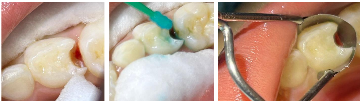
Gambar 3.A. Gambar preparasi dan isolasi daerah kerja; B. Pengaplikasian dentin conditioner asam poliakrilat 25% dengan menggunakan mikrobrush; C. Pemasangan sectional saddle matrix

Tahapan selanjutnya dilakukan disinfeksi menggunakan chlorhexidine 0,2% untuk mendisinfeksi permukaan dentin dan enamel setelah pembersihan jaringan karies. Pemasangan sectional saddle matrix dilakukan pada bagian interdental gigi berguna untuk membentuk bagian proksimal. Gigi yang akan ditumpat diisolasi menggunakan cotton roll pada bagian bukal dan lingual, kemudian diaplikasikan dentin conditioner asam poliakrilat 25% dengan menggunakan mikrobrush dengan waktu 10 detik, setelah itu dicuci dan dikeringkan.