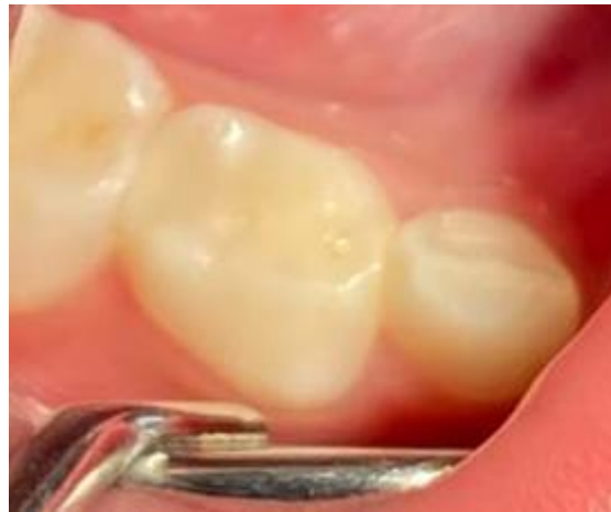
Gambar 6. Kontrol restorasi klas II RMGIC gigi 84 pasca 2 minggu restorasi

84, tidak terdapat pembengkakan, tidak adanya traumatik oklusi, batas tepi restorasi tumpang dengan gigi baik dilihat dari tidak adanya step pada restorasi.