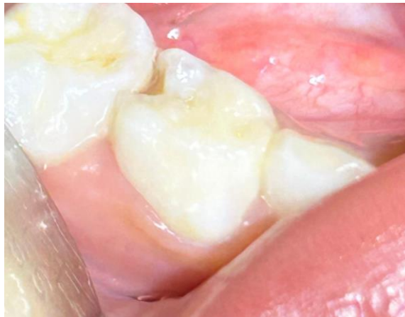
Gambar 1. Gambar awal gigi yang akan dilakukan perawatan restorasi klas II RMGIC.

Anak perempuan berusia 6 tahun datang dengan walinya dengan keluhan gigi berlubang pada bagian bawah belakang kanan. Pasien mengeluhkan gigi berlubang sejak kurang lebih 6 bulan yang lalu, keluhan belum pernah diobati dan belum pernah diperiksakan ke dokter gigi. Pasien tidak memiliki riwayat penyakit sistemik maupun alergi obat. Pemeriksaan ekstraoral pasien normal dan tidak memiliki kelainan apapun. Pemeriksaan intraoral gigi 84 terdapat kavitas pada bagian distal dengan kedalaman dentin. Pemeriksaan objektif didapatkan hasil sondasi (-), perkusi(-), palpasi(-), vitalitas (+). Diagnosis karies dentin gigi 84 ditegakkan, perawatan yang dilakukan berupa restorasi klas II RMGIC.