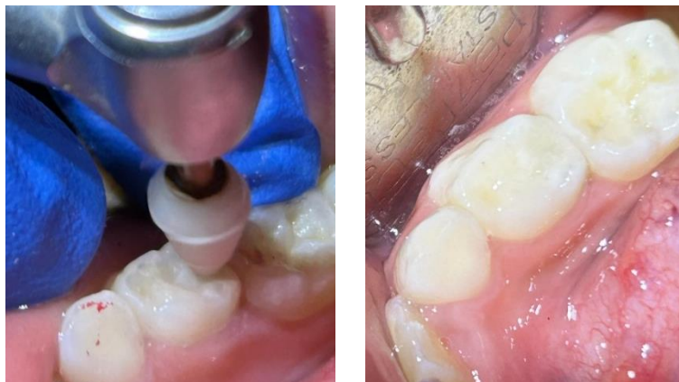
Gambar 5.A. Gambar hasil cek oklusi dan polishing menggunakan enhance polishing ; B. Gambar hasil restorasi klas II dengan RMGIC gigi 84

Tahapan selanjutnya yaitu finishing dengan menggunakan bur finishing dari arah restorasi ke gigi di permukaan oklusal dan menggunakan finishing strip pada permukaan proksimal untuk menghilangkan ekses restorasi RMGIC, kemudian melakukan pengecekan oklusi dengan artikulating paper dan melakukan pengurangan area yang mengalami kontak traumatik.