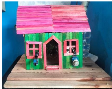
Gambar 1. Prototipe Sistem Pendeteksi dan Pemadam Api

Penelitian ini menghasilkan prototipe sistem pendeteksi dan pemadam api berbasis ESP32 yang dilengkapi dengan sensor flame , sensor MQ-2, relay , pompa air mini, buzzer , dan integrasi notifikasi Telegram [10]. Implementasi perangkat keras ditunjukkan pada Gambar 1.