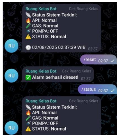
Gambar 2. Notifikasi Telegram yang Dikirimkan Sistem

Setiap kali sensor mendeteksi api atau gas, ESP32 memproses data dan mengirimkan peringatan melalui Telegram. Waktu rata-rata pengiriman notifikasi adalah < 3 detik. Contoh notifikasi ditunjukkan pada Gambar 2.