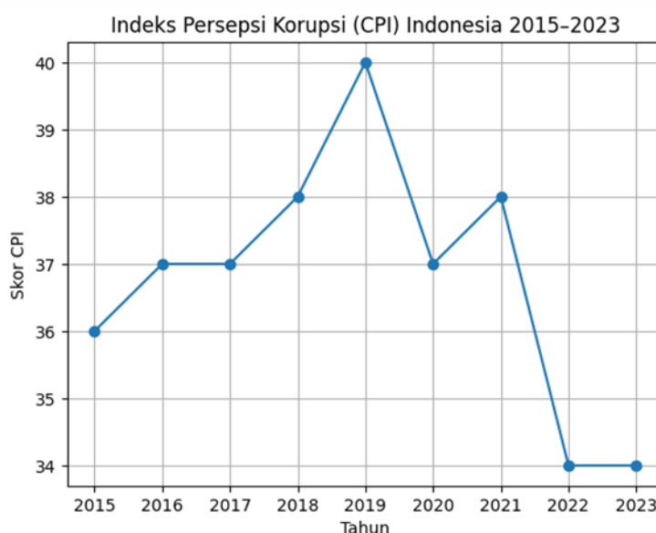
Gambar 1 Grafik Indeks Persepsi Korupsi (CPI) Indonesia 2015-2023

Data empiris menunjukkan bahwa efektivitas pemberantasan korupsi di Indonesia dapat dianalisis melalui indikator global seperti Corruption Perceptions Index (CPI) yang dirilis oleh Transparency International. 55